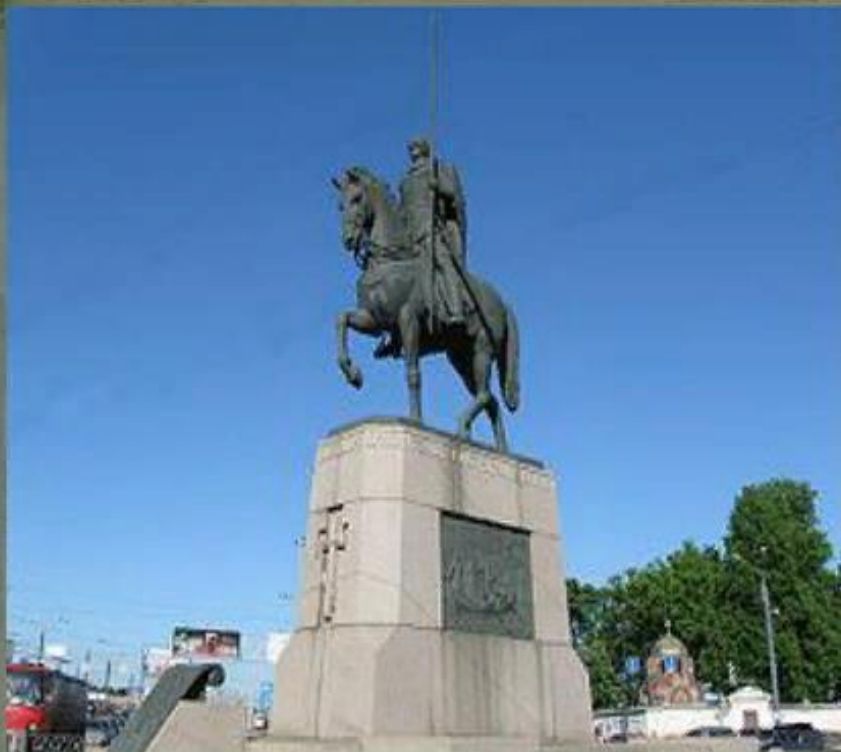
Памятник Александру Невскому в Санкт- Петербурге на площади Александра Невского перед Александро-Невской лаврой