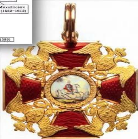
Орден святого Александра Невского