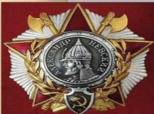
Орден Александра Невского