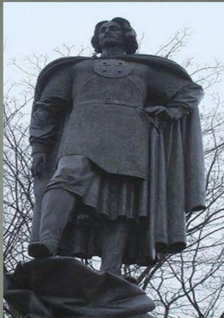
Памятник в Санкт-Петербурге (Усть-Ижора)