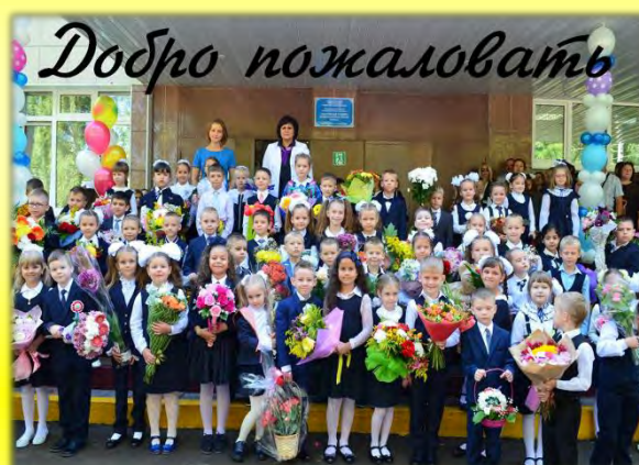
Первый раз в первый класс... стр. 2-3