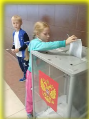
Единый день голосования стр.38-41