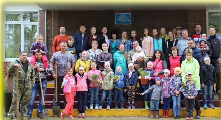
16 сентября 2017 акция «Наш лес! Посади дерево!» стр.6